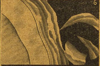
6 Der Zahnstein wird mürbe und durch die Zahnbürste abgetragen

Der offizielle Tonfilm aus der Vatikanstadt