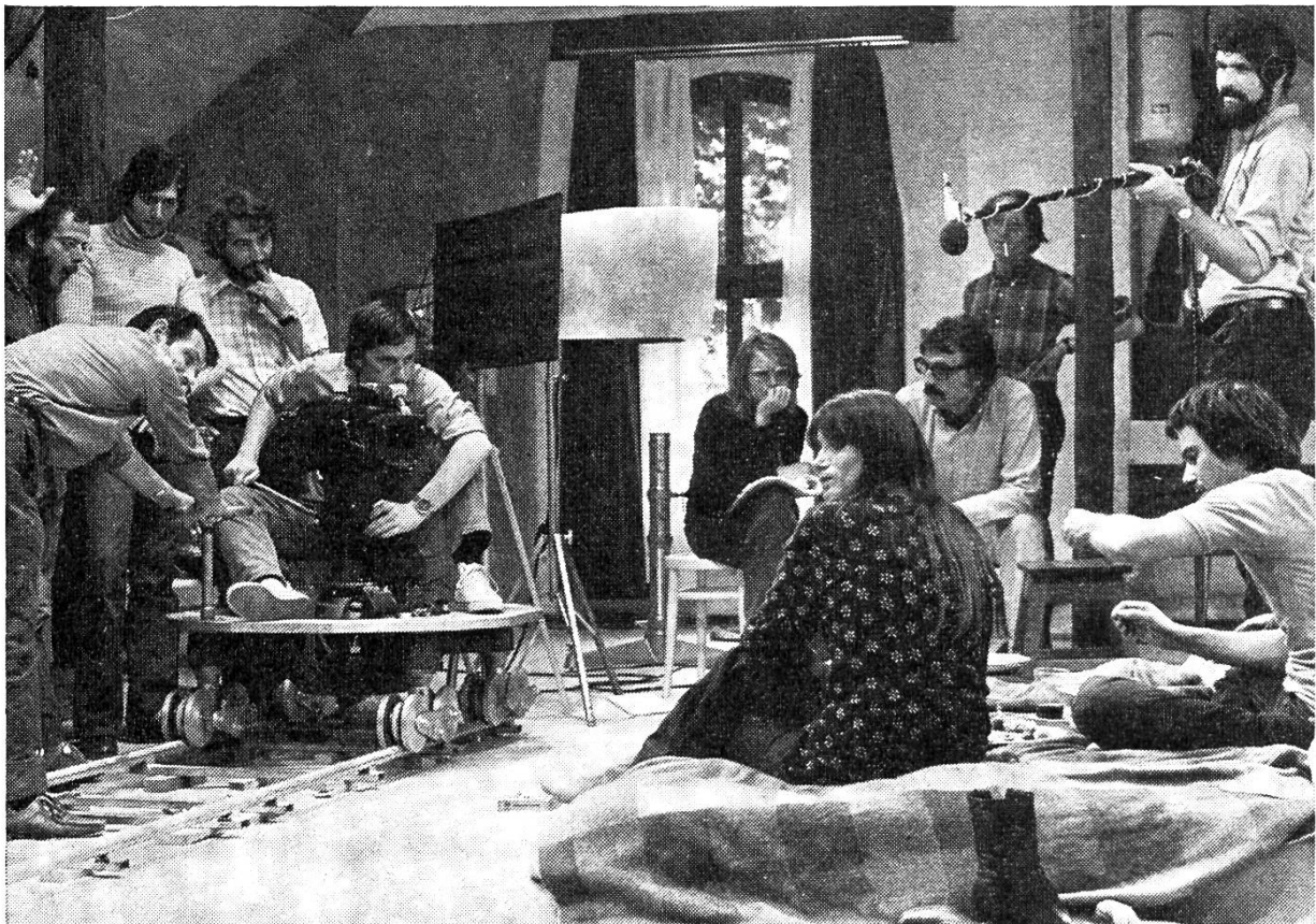
Alain Tanner (vierter von rechts) bei den Dreharbeiten.

Tanner: Das Problem des Urbanismus wird in meinem Film natürlich nicht mit Plänen und Statistiken behandelt, aber wir versuchen doch einige Aspekte des Lebens in einer heutigen (Gross-)Stadt zu geben. Ich will mich klarer ausdrücken: Zu Beginn wohnt das Paar im Herzen der Stadt Genf. Wie das Zentrum der Stadt aber (und wie viele andere Zentren in der Schweiz) zerstört wird, wie die alten Häuser abgerissen und Luxus-Appartements, Studios, Banken und Super-Märkte gebaut werden, sind die beiden gezwungen, in einer Wohnung zu wohnen, die gleich beim Flugplatz liegt: sie leben also in einer unerträglichen «cité dortoire», die tagsüber durch das ständige Starten und Landen der Flugzeuge gekennzeichnet ist.