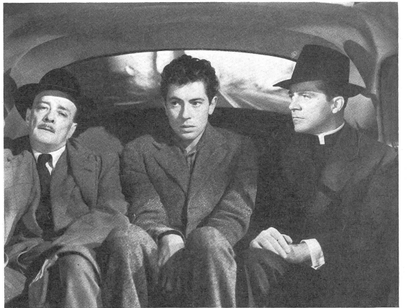
Bild rechts: Martin, der den Pfarrer totgeschlagen hat, mit dem Polizeibeamten erfüllten Mädchen und gereizte Helfen erlauben auch Verdacht gegen ihn hegt, und dem jungen Nachfolger des Erschlagenen, der ihm zugetan ist und noch nichts ahnt. Ein symbolisches Bild: der verlassene, junge, schuldige Einzelmensch, eingekerkert zwischen den beiden grossen Kollektive Staat und Kirche. (Verleih RKO).