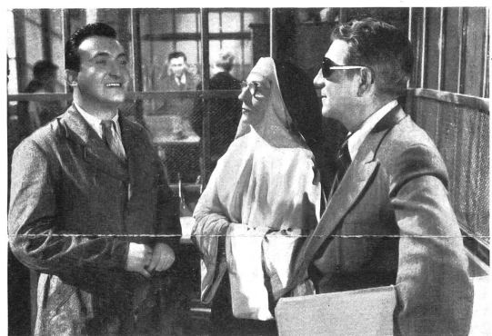
Es gelingt, ihm mit List ins Schulungszentrum für Blinde zu bringen, das ihm zum Sidisalt wird.

matie und List gibt er seine Zustimmung zum Eintritt in ein Schulungszentrum für Blinde, in dessen brüderlicher Atmosphäre er sich bald wohl fühlt. Dort fasst er auch eine Zuneigung zu einer blinden Lehrerin, deren sehender Bräutigam, Wirtschaftsleiter des Zentrums, ihm jedoch aus Eifersucht verrät, dass keine Hoffnung mehr für ihn bestehe, jemals geheilt zu werden. Der harte Schlag treibt ihn zum Selbstmordversuch, um dann jedoch endgültig die Lehrerin mit dem festen Willen an seine Seite zu bringen, ein gemeinsames Glück auch im Dunkel der Nacht aufzubauen. Die Kunst Jean Gabins in der Hauptrolle, von dem es einst hiess, er spiele in keinem Film, in welchem er nicht eine Ermordung darstellen könne, gibt dem Film eine männliche Beherrschtheit, und ver-