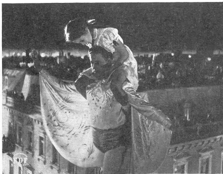
Die Angst des Menschenkinde auf dem hohen Seil (des Lebens): es blickt in die Tiefe und fürchtet sich, starr hinaufzusehen, wo die Verheissung schwebt, sich nicht zu fürchten.

Handlung ist hintergründig, tiefinnig, mit einer Ueberfülle aktueller Beziehungen. Es ist ein modernes Mysterienspiel von Rang, aber auch ein Verkündigungs-film, der uns alle angeht und ausgedehnten Stoff für Diskussionen bietet. — Wir weisen im übrigen auf unsere Kritik im «Dienst» Nr. 4 (April).