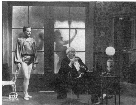
Zwei alte Bekannte, der Bote des Guten und des Bösen, treffen sich. Bild rechts: Der Böse lenkt den Tanz der Welt.

Zuschlag.) Selbstverständlich kann Eintritt verlangt werden. Wird ein solcher nicht erhoben, erhöht sich der Preis um Fr. 5.—. Allfällige Ueberschüsse fallen zur Hälfte dem betreffenden Pfarramt oder Kirchenbehörde für wohltätige Zwecke zu. — Weitere Schmalfilme in Vorbereitung. — Alle Auskünfte durch die Schweizerische Protestantische Film- und Radiozentralstelle, Luzern, Brambergstrasse 21, Telefon (041) 2 68 31.