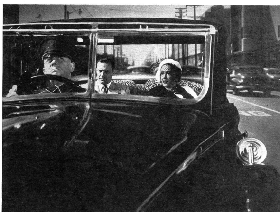
Der ehemalige Filmstar fährt triumphierend an der Spitze seiner früheren Welterfolge ein, einem Anruf zu einer Besprechung folgend. In Wirklichkeit erfolgte die Einladung aus einem viel banaleren Grunde, wie ihr Chauffeur, einst selbst ein berühmter Filmregisseur (E. v. Stroheim) bald herausfinden muss.

film wirklich erlebt und teilweise erlitten haben, z. B. Cecil B. De Mille und vor allem Gloria Swanson in der Hauptrolle, selbst wohl das berühmteste weibliche Opfer des Tonfilms. Sie feiert auf diese Weise als einzige ihresgleichen nach zwanzig Jahren Verschollenheit eine triumphierende Rückkehr, der man nicht ohne Anteilnahme folgen