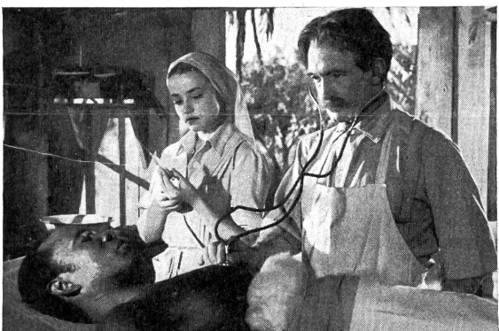
Während der Arbeit in Afrika darf an nichts anderes gedacht werden, auch nicht an die ferne Heimat.

Die Wilden haben so großes Vertrauen zu dem «Weißen Hexer» gefaßt, daß sie sogar ihre Toten bringen, damit er sie auferwecke.