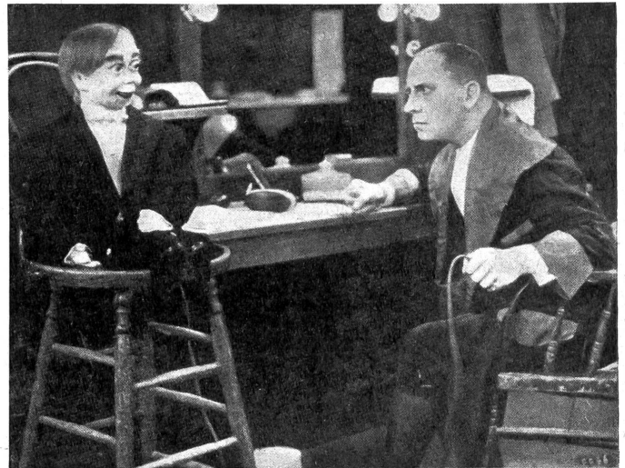
Erich von Stroheim in seinem ersten Tonfilm «The great Gabbo».

Er begab sich auch bald darauf dorthin und fand gelegentlich Arbeit als Extra für Massenszenen. Um diese Zeit begann der berühmte D. W. Griffith seinen Film «Birth of a nation». Stroheim wollte sich bei Griffith einführen lassen, was ihm nicht gelang, bis er auf einen wunderbaren Einfall kam. Jeden Morgen suchte er Griffiths Studios auf und sagte dem Direktionssekretär folgende unabänderliche Formel her: «Erich von Stroheim, Schauspieler, Drehbuchautor, Stunt-Mann, Extra- und Militär-Experte grüßt verbindlichst und wünscht zu wis-