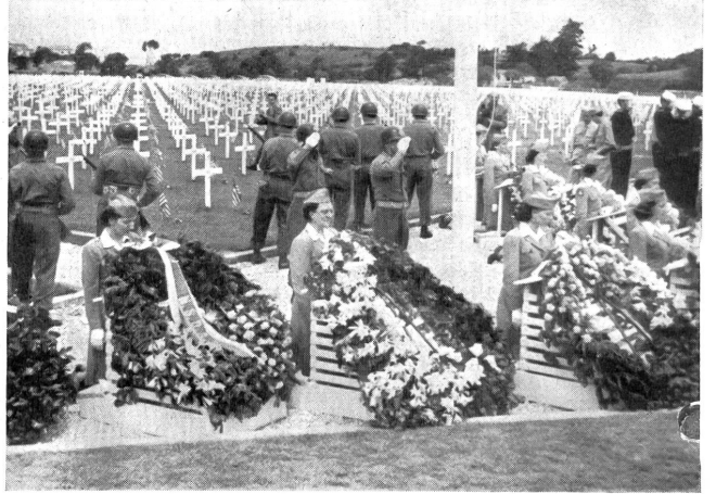
Einweihung eines Friedhofes des Roten Kreuzes in Italien für 10 000 Gefallene.

SCHWEIZERISCHER PROTESTANTISCHER FILM- UND RADIOVERBAND Generalversammlung 20. November 1954 auf Boldern anschließend: Protestantische Filmtagung