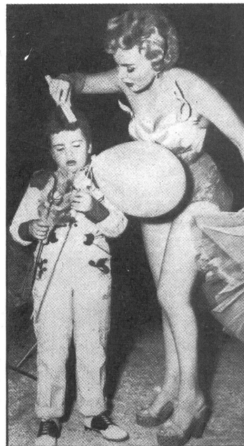
Die Filmschauspielerin Zsa Zsa Gabor bereitet ihr Töchterchen auf die Filmarbeit vor.

SCHWEIZERISCHER PROTESTANTISCHER FILM- UND RADIOVERBAND