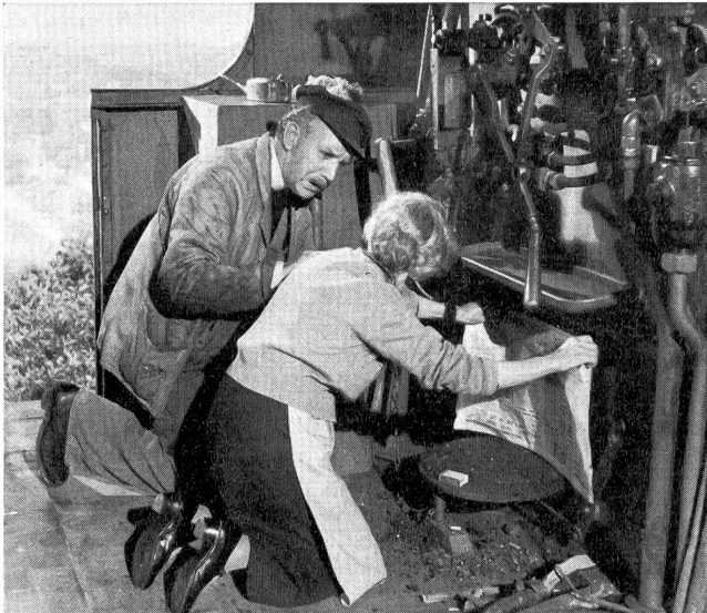
Der Pfarrer als Lokomotivführer treibt am ersten Tag seines neuen Amtes die Frau des verschlafenen Heizers an, die Maschine aufzuheizen.