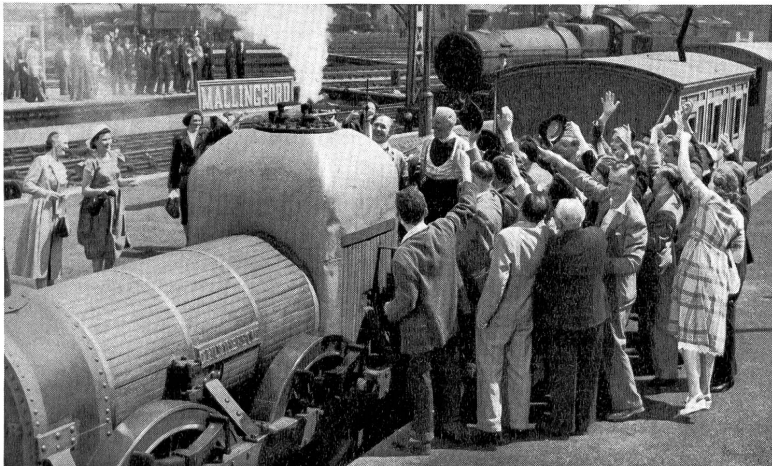
Die dritte, aus dem Museum stammende Lokomotive, der «Donnerschlag», führt im Konkurrenzkampf gegen den Autobus den Sieg der Eisenbahnpartei herbei.