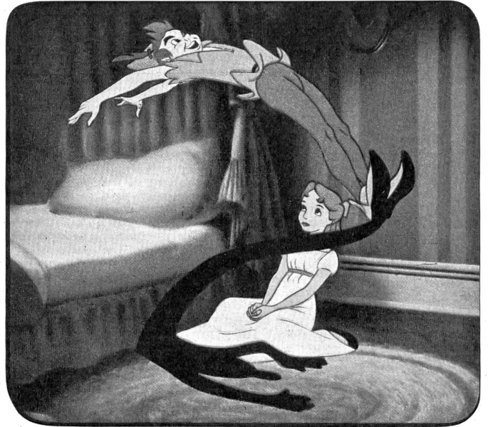
Peter Pan erhält im farbigen Zeichen-Trickfilm gleichen Namens von seiner Freundin Wendy seinen Schatten zurück.

hafte verbindet sich mit dem Sensationellen, Effekthascherischen und dem Erregenden, das uns Angst und Schrecken einjagen soll. Er will Spannung erzeugen und verjagt damit das Poetische des echten Märchens in alle Winde. In Amerika wurde der Film mit Recht als «Märchen-Reißer» bezeichnet, was auch durch köstliche Einzelheiten nicht aufgewogen werden kann. Vieles darin wird die Kinder nicht beeuligen, sondern sie zutiefst erschrecken und ihnen Angsträume verursachen. Mit einem Wort: Disney ist dem amerikanischen «Cartoon»