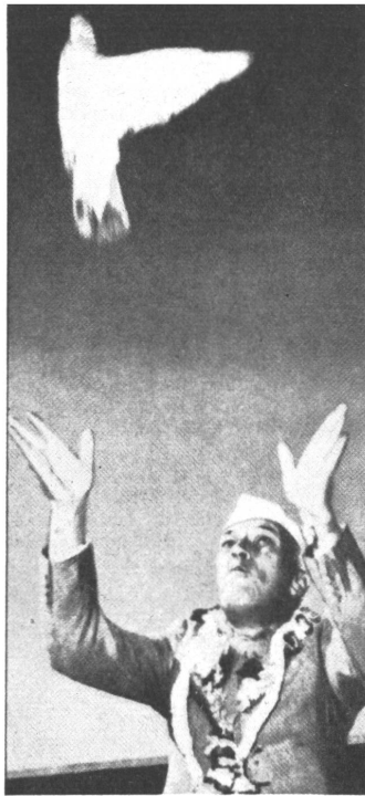
Nehru ließ an seinem Geburtstage Friedens-tauben flattern.