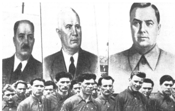
Arbeitermassen müssen hinter dem Eisernen Vorhang vor den Bildern Mikoyans, Chruschtschews und Malenkows verehrend vorbeiziehen, von denen der mittlere die beiden andern gestürzt hat.