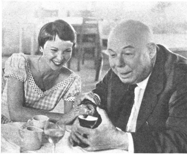
Regisseur Jean Renoir, Sohn des großen Malers und Schöpfer einer Anzahl bedeutender Filme, von denen einige in die Geschichte eingegangen sind, in Cannes nach der erfolgreichen Aufführung seines neuen Films «French Cancan» mit der Hauptdarstellerin Françoise Arnoul.

Evangelist Dr. Billy Graham, der in der englisch sprechenden Welt durchschlagende Erfolge erzielte, spricht heute im Hardturm-Stadion in Zürich. Hier begrüßt er Frau und Kind.