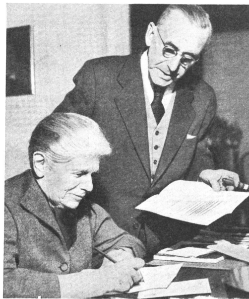
Eines der letzten Bilder von Thomas Mann mit seiner Frau Katja. Mit ihm ist ein Stück alter, bürgerlicher Welt dahingegangen.