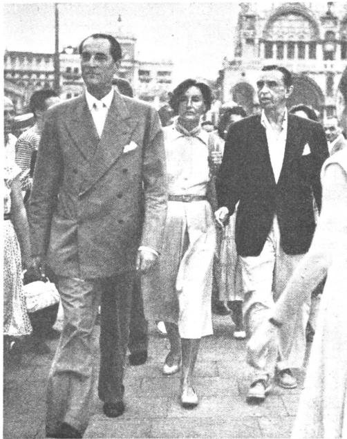
Greta Garbo, das Frauenidol einer Generation, hat sich seit Jahrzehnten erstmals anlässlich eines kurzen Besuches in Venedig widerspruchslos fotografieren lassen.