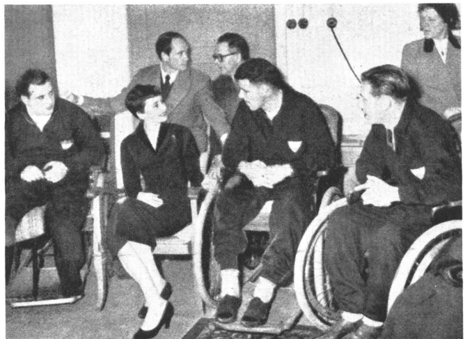
Audrey Hepburn besucht in Doorn nach ihrer Hochzeit Kriegsinvaliden.

In dieser oder einer ähnlichen inneren Lage befinden sich leider noch Hunderttausende in den ehemaligen, kriegführenden Staaten. Es wäre deshalb gut, wenn sich unsere deutschen Freunde vor Augen hielten, daß es keineswegs immer Verachtung oder Haß ist, wenn sich solche Opfer, zu denen auch Audrey gehört, weigern, mit ihnen in Kontakt zu treten. Es kann im Gegenteil ein höchst anerkennenswertes Bestreben dahinterstecken, durch Ausweichen nicht wieder die alten