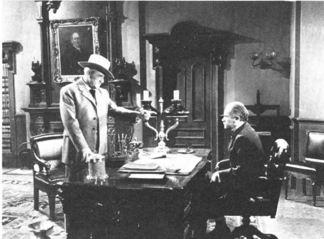
Der patriarchalische Pionier und Großgrundbesitzer, der durch seine alten Methoden mit der wachsenden Staatsgewalt in Konflikt geraten ist, sucht vergebens Hilfe beim Gouverneur, den er selber in den Sattel gehoben hat.

AH. Wildwest-Filme kann man nicht aus den Augen lassen, zu viele Leute fühlen sich von ihnen angezogen. Ihre unbestrittene Frische und Vitalität, ihr einfacher Inhalt, die kühnen Männer, die auf feurigen Pferden im letzten Moment gerettet werden, damit das Gute siegt, sprechen breite Schichten an. Leider