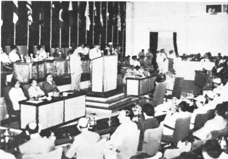
Die soeben zu Ende gegangene Konferenz von Bandung, die uns mehr angeht als viele glauben. Staatspräsident Soekarno präsidiert.