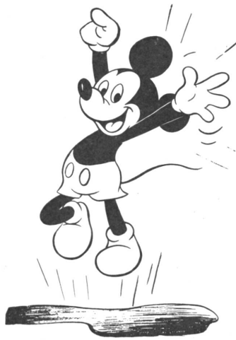
Mickey Mouse, Disneys unvergängliche Schöpfung, ein Selbstporträt?

«Kitsch?» Wie viele Leute trauern den Märchenfiguren ihrer Jugend nach und empfinden Mickey als Einbruch in die Welt der Schneewittchen, Rumpelstilzchen, Aschenbrödel, Kröten mit goldenen Kronen usw. Es ist wahr, Mickey hat jenen Hauch des Wundersamen nicht. Sie steht mitten im