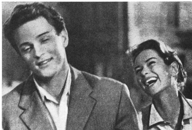
Das fröhliche Studentenehepaar aus Castellanis neuem Film, der junge Leute zeigt, die sich positiv zur Welt stellen.

Castellani ging gleich vor, wie er es schon im Film «Für zwei Groschen Hoffnung» getan hatte: Er ersuchte seine Schwägerin, ihm alle ihre Erlebnisse, von der ersten Begegnung mit ihrem Mann über die Flucht bis zum Ende ihrer Schwierigkeiten, das erst nach Jahren sich einstellte, in allen Einzelheiten niederzuschreiben. Sie besorgte dies gründlich, und er bekam ein Buch mit über 500 Seiten. Die Nöte einer