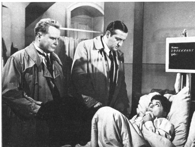
Die beiden Kriminalbeamten versuchen vergebens, aus der im Spital liegenden Unbekannten herauszubekommen, wer sie ist.

ms. Hat Anastasia, die ältere Tochter des Zaren, die Ausrottung ihrer Familie überlebt? Die Frage beschäftigt seit dem Jahre 1920, als in Berlin eine junge Frau auftauchte, die behauptete, diese Anastasia zu sein, nicht allein die fürstlichen Häuser Europas, sondern Ärzte, Juristen, Behörden und Gerichte, die Journalisten und die Liebhaber