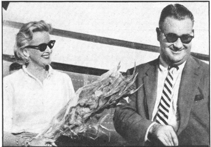
Robert Aldrich, der Regisseur des in dieser Nummer besprochenen Films «Attack», mit seiner Frau. Der Film führte in Amerika zu heftigen Polemiken wegen seiner Vorurteilslosigkeit.

Persönlich lebt er ganz zurückgezogen, schon weil er überaus stark kurzsichtig ist, was ihm die Teilnahme an allen öffentlichen Veranstaltungen unmöglich macht. In den Vorstellungen sitzt er zuvorderst, mit einem großen Feldstecher bewaffnet. Seit einiger Zeit ist er allerdings auf große Reisen gegangen, wie man munkelt im Auftrag der Hollywooder Filmindustrie. Er hält sich dabei längere Zeit auch in den europäischen Städten auf, offenbar, um Hollywood mit dem zu beliefern, was es am dringendsten braucht, Stoffe, Talente, Voraussagen und Berichte über die europäische Kundschaft, die für Amerika immer wichtiger geworden ist.