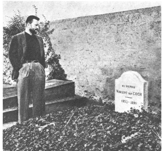
Kirk Douglas, der eben einen Film über das Leben des großen Malers Van Gogh beendet hat, in welchem er die Hauptrolle spielt, am Grabe des Malers in Auvers.