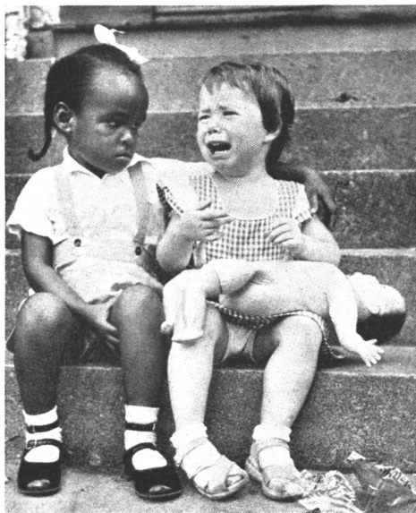
Die Aufhebung der Rassentrennung in den Schulen des Südens der USA wird von den Weißen bekämpft. Schwarz möchte schon — aber Weiß hat Angst.

Guy Mollet, zur Zeit als Regierungspräsident im Vordergrund, allein mit den leeren Sitzen der Provinzvertreter nach einem Kongreß. Werden sie auch ihn im Stich lassen?