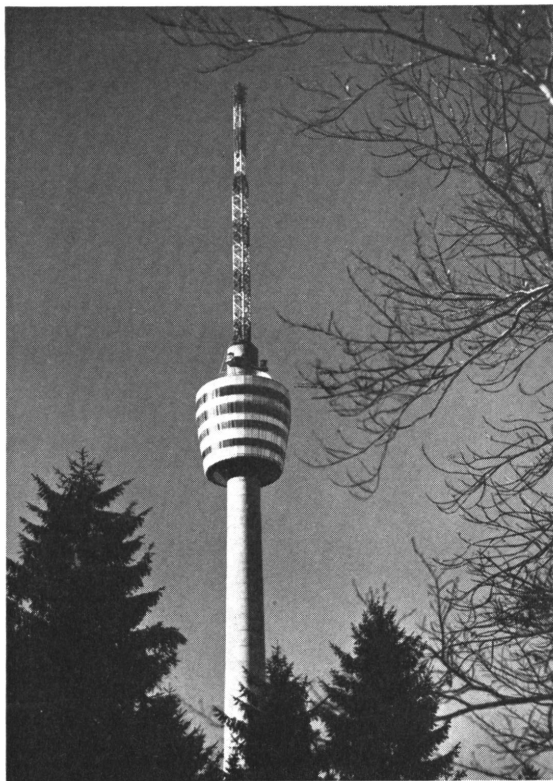
Der neue deutsche Fernsehsender auf dem Hohen Bopser bei Stuttgart, der auch stellenweise in der Schweiz empfangen werden kann. In dem Korb ist auch ein Ausblicksrestaurant untergebracht.

Laurence Olivier in seinem neuen, großen Shakespeare-Film «Richard III.» in der Hauptrolle während einer Sendepause. Er hat den Film für zwei Millionen Schweizer Franken dem Fernsehen in Amerika zur dortigen Uraufführung überlassen.