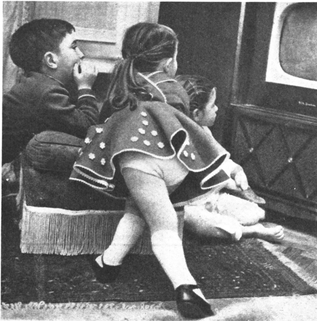
Filme jetzt auch für die Jüngsten, sogar ohne Zensur — aber im Fernsehen.