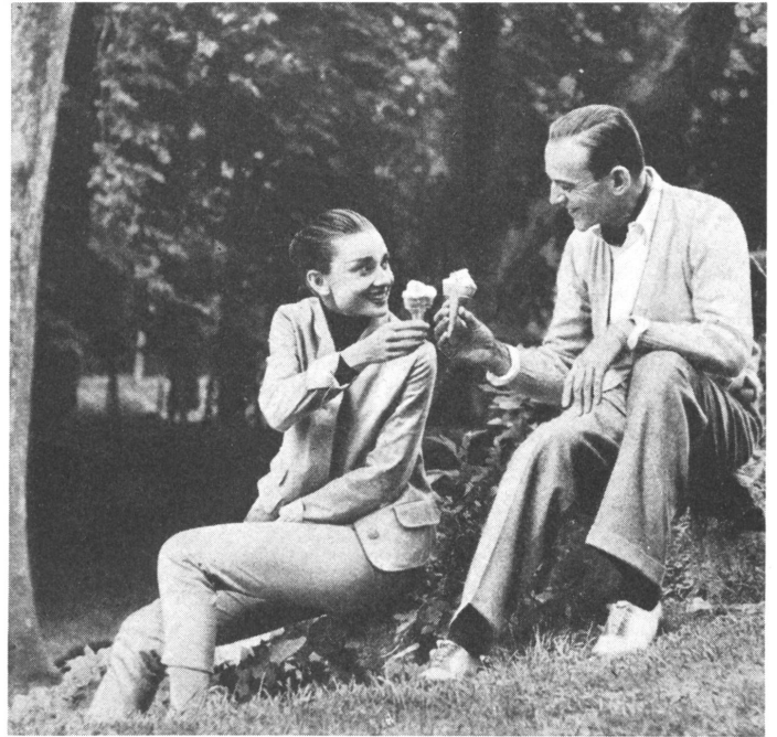
Die volkstümliche Audry Hepburn dreht in Paris mit Fred Astaire erstmals einen Tanzfilm, nachdem «Krieg und Frieden» beendet ist. Hier genießt sie eine Arbeitspause.