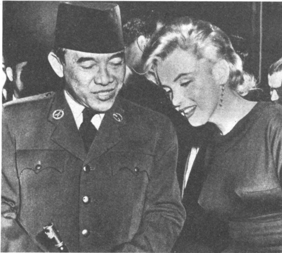
Der indonesische Präsident Soekarno hat auf seiner Weltreise auch Filmstars seine Reverenz erwiesen. Bevor er nach Bern auf Staatsvisite fuhr, unterhielt er sich noch mit Marilyn Monroe.