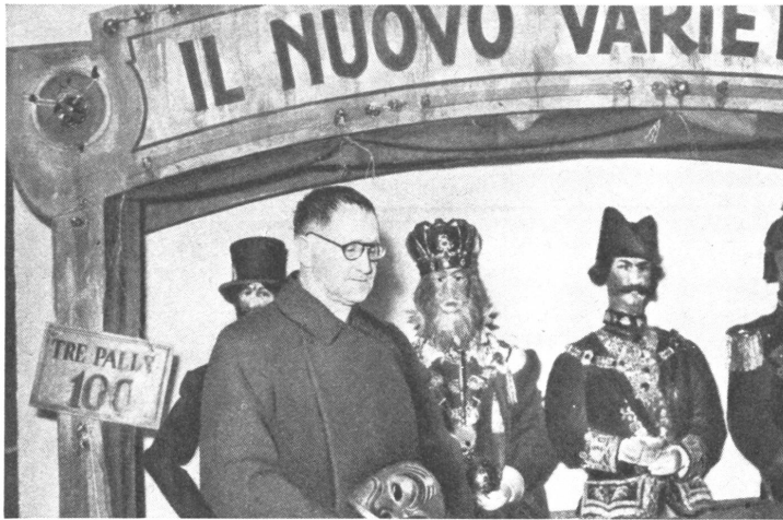
Bert Brecht, der ostdeutsche Dramatiker und Verfasser der «Drei-Groschen-Oper», die auch verfilmt wurde, weilte in Italien, um ostdeutsch-italienische Filmbeziehungen anzuknüpfen, was anscheinend mißlang. Hier besichtigt er ein italienisches Puppentheater.