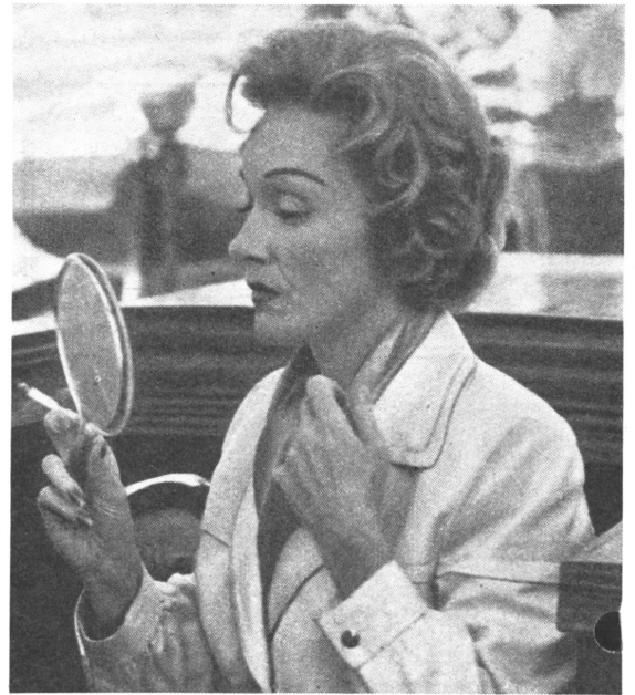
Marlene Dietrich, wie Brecht ebenfalls aus Berlin stammend, längst Großmutter, hat unverwüstlich mit De Sica in Montecarlo einen neuen Film gedreht, die «Montecarlo-story».