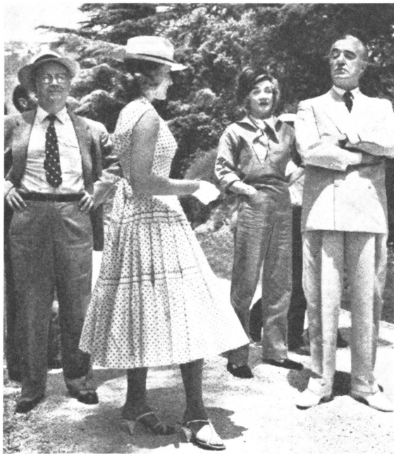
De Sica begegnet der jungen, vom Fernsehen herkommen- den Schauspielerin Natalie Trundy (im Vordergrund) im neuen Film «Monte-Carlo Story». Zwischen beiden Marlene Dietrich.