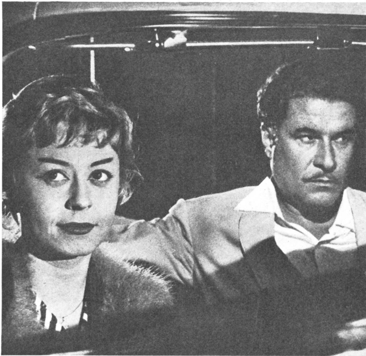
Giulietta Masina dreht nach der «Strada» einen neuen Film ihres Gatten Fellini, wo sie wieder eine arme Enterbte darstellt, die trotzdem das Leben liebt. Hier ist sie mit Amadeo Nazzari zusammen. («Die Nächte der Gabiria».)