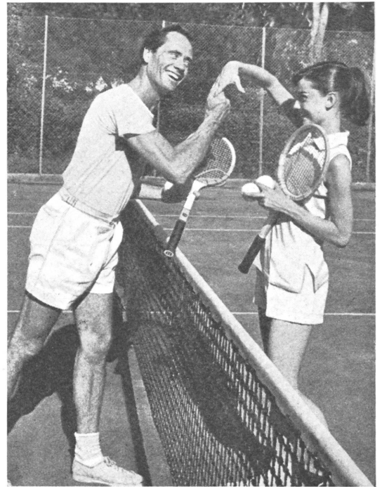
Mel Ferrer spielt mit seiner Frau Audrey Hepburn Tennis. Sie besitzen auf dem Bürgenstock ein Chalet.