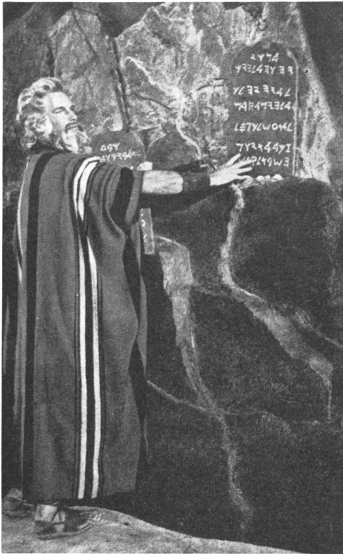
Moses erhält am Berge Sinai die Zehn Gebote, darunter auch dasjenige: Du sollst nicht töten! (Aus dem neuen De-Mille-Film «Die Zehn Gebote».)