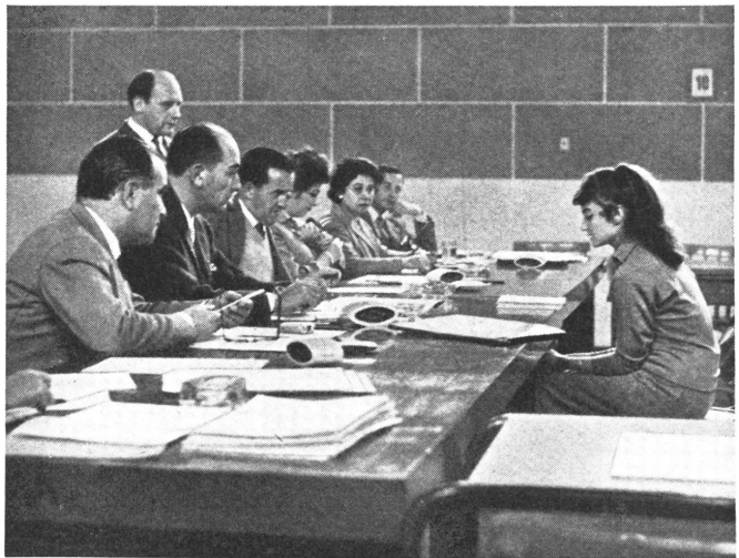
Das ersehnte Ziel vieler junger Mädchen, die zu Film und Theater drängen: Lese- probe vor einer Prüfungskommission.