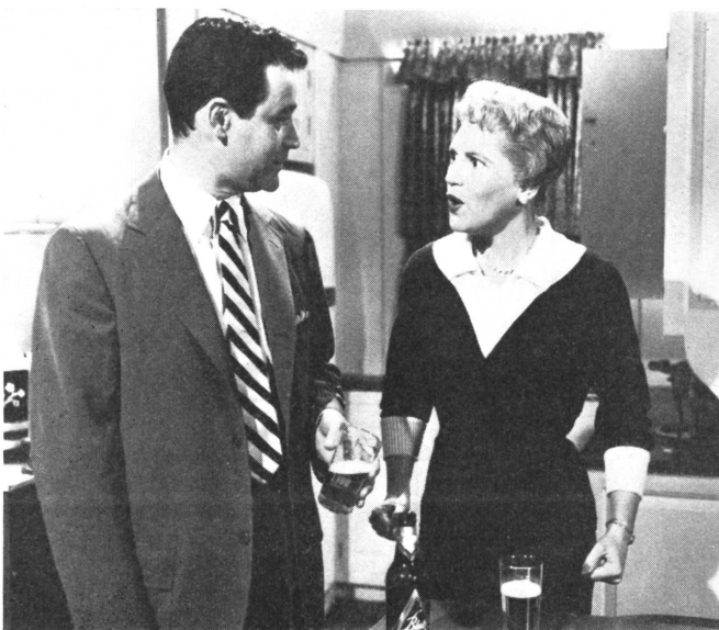
Das Ehepaar, das sich scheiden läßt, um nach mannigfachen Umwegen wieder den Weg zurück zu finden, ein Thema, das man gerne ernsthafter sehen würde.

FH. Ein Problem, das uns wie ein Pfahl im Fleische sitzt, wird hier auf heitere Art anzufassen versucht: die Scheidung. Der Titel ist amerikanisches Asphalt-Rotwelsch: wer in Amerika «Phfft» gemacht hat, ist geschieden. Schon das ist ein Symptom für die Leichtigkeit, mit der heute in aller Welt ein so tiefgehender Vorgang wie der Schiffbruch einer Familie betrachtet wird. Aber vielleicht sind wir heute so weit, daß man den Leuten gewisse Wahrheiten darüber nur noch in der Maske des Clowns sagen kann.