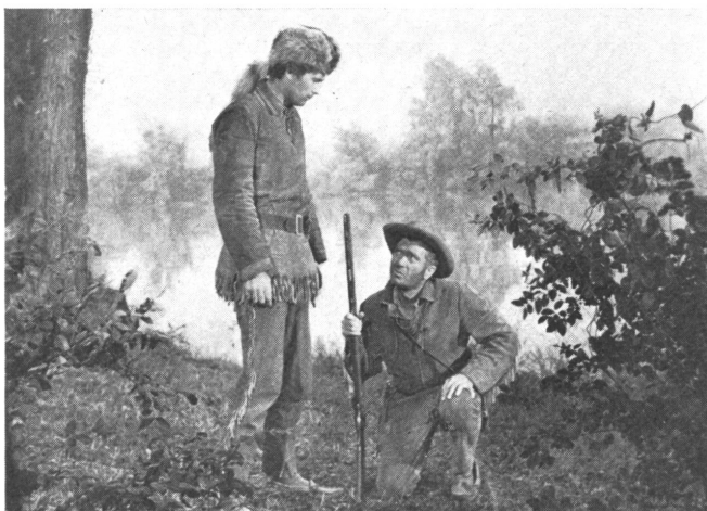
Davy Crockett, der tapfere Trapper (links), ein Kämpfer für das Recht im Wilden Westen, in Amerika noch heute unvergessen.

kanischen General Santa Ana, der in der ersten Hälfte des vergangenen Jahrhunderts New Mexiko aus dem amerikanischen Staatenbund raubte, fiel er, ein Held der Freiheit, ein Liebling des Volkes. In den Liedern wurde er besungen, in den Balladen gefeiert. Legende und Wunschbild legten sich um seine Gestalt, und das Andenken an ihn ist bis heute nicht erloschen. Er war ein großer Mann, im doppelten Sinne des Wortes. Und die amerikanische Nation huldigt ihm.