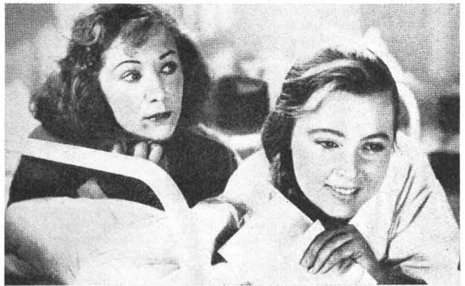
Russische Mädchen aus dem in Karlsbad gezeigten russischen Film «Der Fall Rummyantsew».

weit wird man sie «oben», wo man über Gefängnisse und Henkersknechte verfügt, dulden? Darüber bestand keine Klarheit, und man hatte das Gefühl, auch «oben» nicht (vielleicht nicht einmal «ganz zu allerberst», das heißt in Moskau). Zweifellos konnten jetzt westliche Filme, wie z. B. die beiden italienischen, gezeigt werden, die keinerlei politische Tendenz aufweisen. Ferner sah man einzelne östliche Filme, die man beinahe eher als brav westlich-neorealistisch ansprechen muß. Andererseits ist der (an diesem Ort schon besprochene), ostdeutsche Film «Ernst Thälmann» von Maetzing gezeigt worden, der noch ganz in die Stalin-Periode gehört und dem abgeschafften Persönlichkeitskult in stärkstem Maße fröhnt. Auch die Preisverteilung war bezeichnend; das Festival stand unter dem Motto einer «besseren Freundschaft und Verständigung zwischen den Völkern». Demzufolge bekam der eher schwache Film «Si tous les gars du monde» den Preis, der in fast kindlicher Weise den beteuerten, honigsüßen Absichten des Festivals entspricht. «Marty» überragte ihn und die andern turmhoch, wurde aber beiseite geschoben. Er scheint nur zugelassen worden zu sein, um den Kontrast zwischen der «faulen und satten» Welt des Westens und der pädagogisch optimistischen und auftrumpfenden kommunistischen zu zeigen.