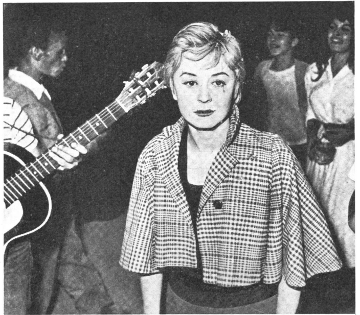
Stroheim, dessen Wirken als Schauspieler und Regisseur der Filmgeschichte angehört, erhält in Paris das Kreuz der Ehrenlegion. «Die Nächte der Cabiria», Fellinis neuer Film mit Giulietta Masina, ist fertiggestellt. Trostlos kehrt hier Cabiria am Ende vieler Enttäuschungen wieder in ihr gewohntes Leben zurück.