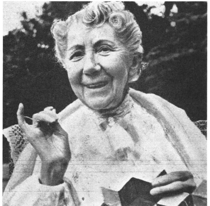
Katie Johnson, die unvergeßliche alte Dame aus den «Ladykillers», starb im Alter von 78 Jahren. 1955 mit der Auszeichnung «beste Schauspielerin Englands» bedacht, konnte sie auf 61 Jahre Bühnen- und Filmtätigkeit zurückblicken.