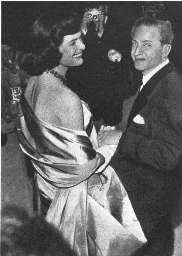
Jules Dassin («Rififi»), der den sehr bemerkenswerten Film «Celui qui doit mourir» schuf mit der griechischen Schauspielerin Melina Mercouri, die darin die Hauptrolle spielt, in Cannes.