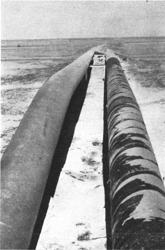
Ein scheinbar monotones Bild, in Wirklichkeit einer der heißesten Punkte der Weltpolitik: Die Oelleitung auf syrischem Gebiet, auf welches Moskau starken Einfluß gewonnen hat. Westeuropa und die USA werden dies kaum dauernd hinnehmen können.

Vor Erscheinen der Atombombe war die Ueberzeugung allgemein, daß es manche Dinge gäbe, die einen Kampf mit den Waffen wert wären, selbst auf die Gefahr des Ausbruchs eines Weltkrieges hin. So blutig und ausgedehnt die Zerstörungen bereits geworden waren, so stand doch die Möglichkeit der Totalvernichtung einer Nation außer