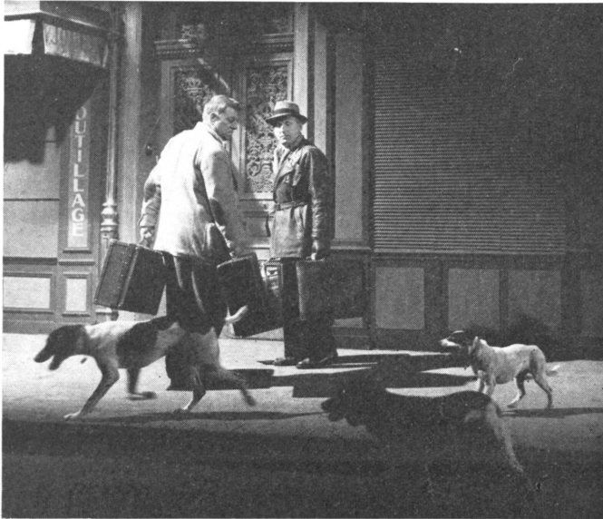
Heimlich wird das schwarzgeschlachtete Fleisch in Koffern durch das deutschbesetzte Paris transportiert, aber die Hunde haben etwas gemerkt. (Jean Gabin und Bourvil.)

ms. Das ist ein Film, der uns zurückversetzt in die Atmosphäre und die Verhältnisse von Paris während der Besetzung durch die Deutschen. Er spielt sich in einer jener Nächte ab, da der Schwarzhandel auf Schleichwegen durch die Metropole pirschte. Die Sache beginnt burlesk. Da wird man in einen dunklen Keller geführt, wo heimlich ein Schwein, in einem großen Reisekorb hereingeschmuggelt, geschlachtet wird. Fein säuberlich zerlegt, wird das tote Tier in Koffer verpackt. Zwei Männer, ein arbeitsloser Taxichauffeur, der sich vom