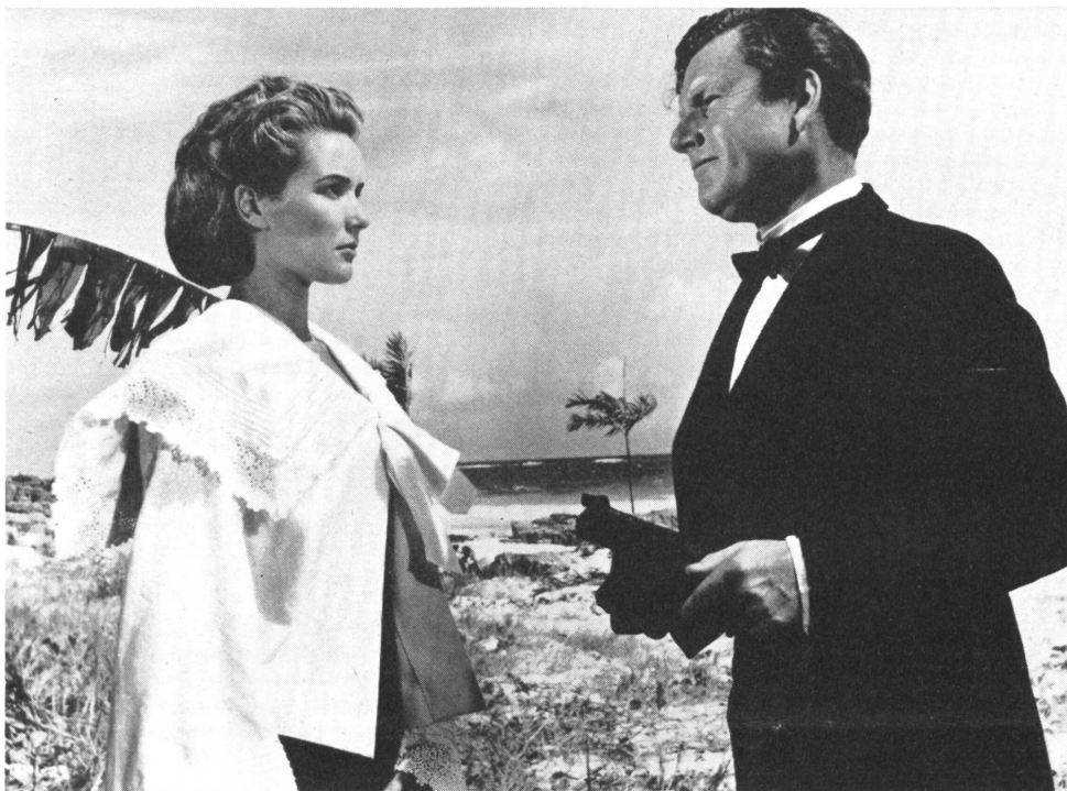
Ein heiterer Sommerfilm

LAUPEN, 27. JULI 1957 9. JAHRGANG, NR. 15