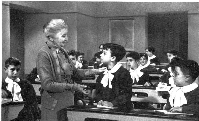
Die grosse Schauspielerin Emma Grammatica erscheint nochmals als Lehrerin in dem heiter-rührenden italienischen Film "Unsere schönsten Jahre".

ZS. Die Reklame für den Film stellt V. de Sica heraus, doch hat er nur eine Nebenrolle. Getragen wird der Film von einer grossen Schauspielerin, die aus einer andern Epoche der Schauspielkunst noch in unsere Zeit hinübertragt, und die man schon längst nichtmehr zu Gesicht bekam: Emma Grammatica. Ihretwegen ist er wohl auch in erster Linie gedreht worden. Sie stellt eine alte, etwas müde, aber noch immer tapfere Lehrerin im Abendlicht dar, die sich noch mit letzten Kräften für ihre Schule wehrt, welche durch Bauspekulation zerstört werden soll. Menschenkenntnis, Klugheit und der Schatz an Liebe und Freundschaft, den sie sich in Generationen von Schülern angelegt hat, gestatten ihr zuletzt den Sieg über ihre Widersacher, den sie human benützt. Als sie durch unlautere Machenschaften der Spekulanten in Bedrängnis gerät, und das Schicksal ihrer Schule und ihr eigenes besiegelt erscheint, eilen die alten Schüler herbei, um ihr mit Erfolg beizustehen. Kontrastiert wird dieses einfache Geschehen durch eine hübsche Liebesgeschichte, in welcher die abgeklärte Weisheit des Alters gegenüber der Torheit der Jugend hübsch ins Licht gesetzt wird. Der Schluss entgeht nicht ganz einer gewissen Rührseligkeit, wie auch sonst in einigen Längen etwas direkt an sehr simple Gefühle appelliert wird, doch ist im Ganzen ein netter, mit Takt, viel Wärme und Lächeln hergestellter kleiner Film entstanden, in welchem wir nochmals eine grosse Künstlerin einer grossen Theaterperiode sehen dürfen.