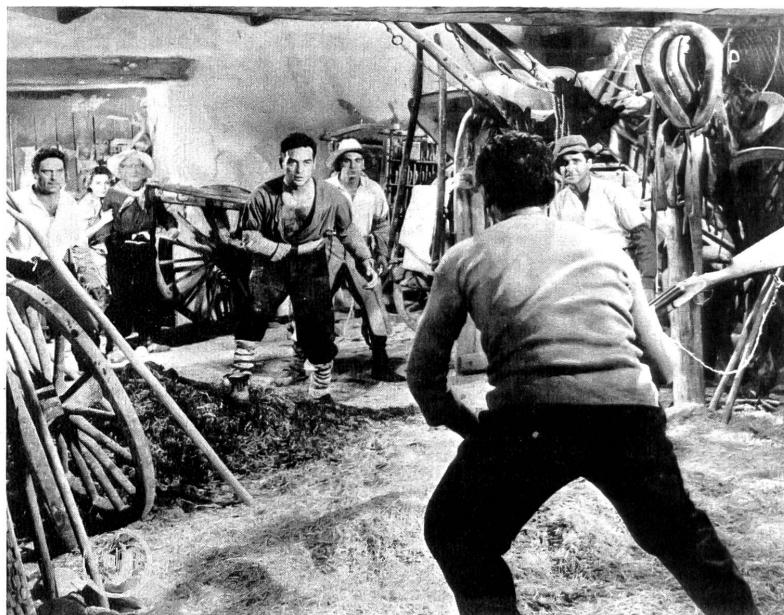
In ausgezeichneter Gestaltung, wenn auch zeitweise überchargiert, erscheint Bardems heisser Film "La Venganza".

ms. Juan Antonio Bardem, der Schöpfer der unvergesslichen Filme "La muerte de un cyclista" und "Calle Mayor", hat diesen Film 1957 geschaffen und 1958 in Cannes am Festival gezeigt. Jetzt endlich ist er auch zu uns gekommen. Es ist ein interessanter, filmisch hervorragender, inhaltlich sozialkritischer, leider aber auch melodramatischer Film. Erzählt wird die Geschichte von Landarbeitern, Bauern aus Spaniens Berge, die ins Tiefland ziehen, als Tagelöhner sich auf grossen Höfen verdingen, karges Brot verdienen, arme Leute, geplagt, verdächtigt, nur geduldet, nicht geliebt, in ständiger Auseinandersetzung mit der Bevölkerung, bei deren Arbeit sie mithelfen. Hineinverwoben ist eine Geschichte der Rache, des Zwiekampfes zwischen dem Helden und einem Verräter, der jenen durch einen Meineid einst ins Gefängnis gebracht hat und der nun die Rache des Heimgekehrten erlebt. Freilich, die Rache wird nicht so heiss gegessen, wie sie gekocht wurde, alles endet im Verzeihen. Der Film wirkt in dieser Handlungsführung konstruiert, überpathetisch, ist Abbild einer leidenschaftlichen Menschenrasse. Gut ist er hierin nicht. Hervorragend aber die Landschaftsschilderung, die Unendlichkeit der kastilischen Hochebene, deren pathetische-Schau immer wieder an Eisensteins Mexikofilm erinnert.