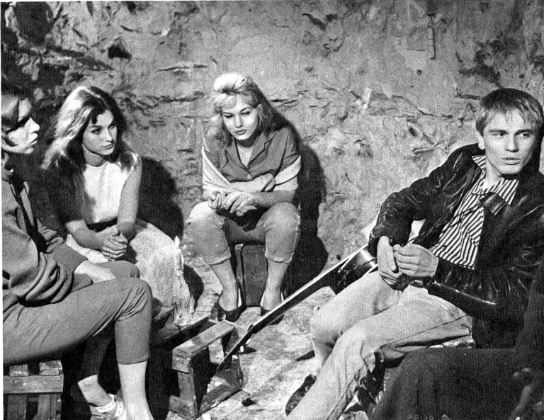
Verschlampt sucht sich eine unsichere Jugend in Kellerlokalen im Protest gegen die Welt selbst zu erleben. ("Beat Girl")

ms. Ein englischer Film über die Halbstarke. Edmond T. Gréville hat ihn gedreht nach einem Roman von Dail Ambler. Die Geschichte ist höchst melodramatisch und hängt die übliche Kolportage an die Halbstarke-Aktualität. Heldin, gar keine müde, sondern eine höchst rebellische und temperamentvolle, ist ein eben den Kinderröcken entschlüpfes Mädchen, das sich gegen die zweite Frau seines Vaters, eine hübsche Französin, schlecht aufführt, in ihr eine Nebenbuhlerin in der Liebe zum Vater hasst und alles tut, um ihr zu schaden. Sie schnüffelt solange herum, bis sie erfährt, dass die Stiefmutter, diese gewandte, verständnisvolle Frau, einst eine Animiertänzerin gewesen ist. Die meisten Szenen spielen in Kellerlokalen, wo frenetisch und akrobatisch getanzt wird und wo die Jugendlichen mit ihren trotzig-Mündern und verschlammten Kleidungen seltsame Mutproben ablegen. Der Film ist atmosphärisch gelungen, hat einen wilden, sich steigernden Rhythmus und ist für alle Jazzfans ein Genuss. Für andere Leute ist er es weniger.