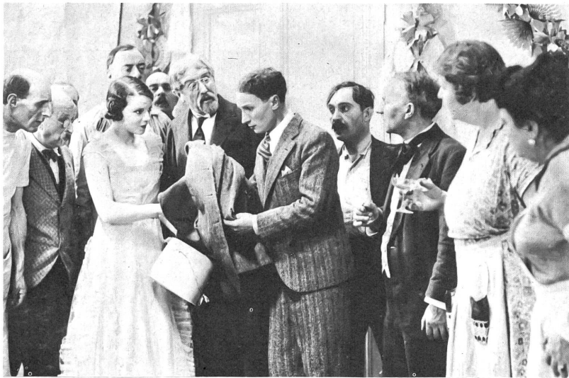
Eine verlorene Jacke als Anlass für eine Fülle von heiterer Pantomime, Musik, bitterer Ironie bei heimlicher Liebe zum Leben in Clairs "Die Million".

In diesen Film ist das Publikum erstmals in der Filmgeschichte gegangen, nicht angezogen vom nichtssagenden Titel, sondern wegen des Regisseurs. Nicht lange vorher war sein ebenfalls unvergesslicher "Unter den Dächern von Paris" erschienen, und alles strömte hin, um das neue Werk zu sehen. Es wurde belohnt, denn mehr noch als im ersten Film meistert hier Clair die Kunst der Verschmelzung von Bild und Ton. Beide werden kontrapunktisch gegeneinander verwendet; bald ist die Musik z.B. das Wesentliche und das Bild begleitet, bald wieder umgekehrt. Keines kommt ohne das andere aus. Dazu werden lustige Dekorationen geschaffen, Parodien des Wirklichen, und durch einen Schleier hindurch fotografiert, was ihnen erstrecht etwas Verdreht-Weiches gibt. Und in allem steckt erst noch die Pantomime, der Tanz. Es ist ein feenhaftes Vaudeville, wobei die Handlungen der Hauptpersonen jedoch in ihrer Uebertreibung auf eine genaue Beobachtung der Wirklichkeit zurückgehen. Dabei artet nichts ins bloss Schwankhaft-Ueberrückte aus, weil hinter allem ein um die Bitterkeit des Lebens Wissender steckt, der das Leben resigniert im Licht einer melancholischen Ironie sieht, die eine grosse, heimliche Liebe zu allem Lebendigen verrät. Diese warme, zärtliche Zuneigung, voller Verzicht, verborgen in einer manchmal bitteren Ironie, ist wohl das Geheimnis der Strahlkraft der besten Filme René Clairs, soweit es sich vielleicht in Worte fassen lässt, und verleiht ihnen einen Hauch Unsterblichkeit.