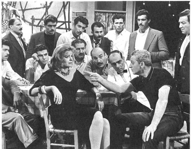
Ilya und der bekehrungs-süchtige amerikanische Kulturschwärmer im formal hervorragenden, jedoch in der Aussage fragwürdigen Dassin-Film "Niemand am Sonntag". (Melina Mercouri und Jules Dassin)

ZS. Von französischer Seite ist hier einer der interessantesten Kriegsfilme nach "Mein Kampf" von dokumentarischem Charakter ge-