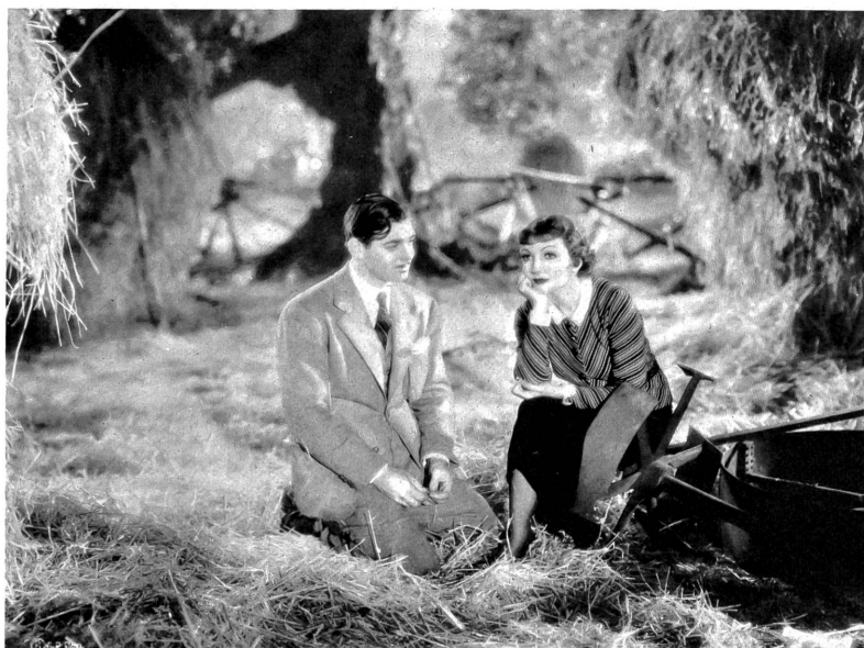
Die entlaufene, widerspenstige Millionärstochter auf dem Wege der Wandlung und zur Ehe in "Es geschah in einer Nacht".

ZS. Unerntester Film aus dem Leben der amerikanischen Besetzungstruppen in Japan. Dies scheint aus lauter Vergnügungen zu bestehen, sofern man dem Film glauben will. Kleine Zwischenfälle wie der Krieg in Korea, bei dem immerhin eine beträchtliche Zahl Amerikaner ums Leben kam, scheinen nicht zu zählen. Man hat eine Menge Zeit, um eine Menge Unfug zu treiben. Zum Beispiel scheint es möglich zu sein, dass man als amerikanischer Soldat ständige Wohnung in einem Geishahaus nehmen darf (vorausgesetzt, dass man sich vorher die Plätze durch entsprechende Geschäfte sicherte). Es stellt sich dabei heraus, dass die wohlgezogenen Geishas keineswegs das sind, für was sie die Amerikaner zuerst betrachtet haben. Darauf ist der Film aufgebaut. Mit der unfreiwilligen und unerwarteten Hilfe der Presse können sie sogar das Geishahaus schliesslich in ein Waisenhaus verwandeln. Nach vielen Frivolitäten und Radau kommt es also zu dem für