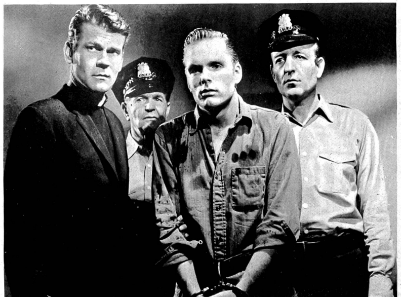
Am Beispiel eines völlig verwirrten, aus Angst zum Verbrecher gewordenen Aussenseiters klagt Don Murray (links) als "Lumpen-Priesters" in seinem Film die heutige Justiz an.

Mehr am Rande wird auch die Todesstrafe angegriffen. Sie ist für den Verurteilten überhaupt unverständlich, eine unbegreifliche Not. Die Gaskammerszene lässt einen Augenblick bedeutend die ganze Problematik des heutigen Strafvollzuges erkennen und ist die überzeugendste Szene überhaupt, auch vorzüglich gespielt. Schade, dass sie nicht den Schluss des Filmes bildet, dass die Regisseure immer wieder viel zu wenig auf die Kraft der Bildersprache vertrauen und glauben, noch mit zusätzlichem Gerede alles extra deutlich machen zu müssen. Don Murray hat sich nur allzusehr der Rolle hingegeben, er versteigt sich nicht selten in melodramatische Pathetik. So kann man wohl zur Aussage des Films Ja sagen, jedoch nicht zu seiner Gestaltung.