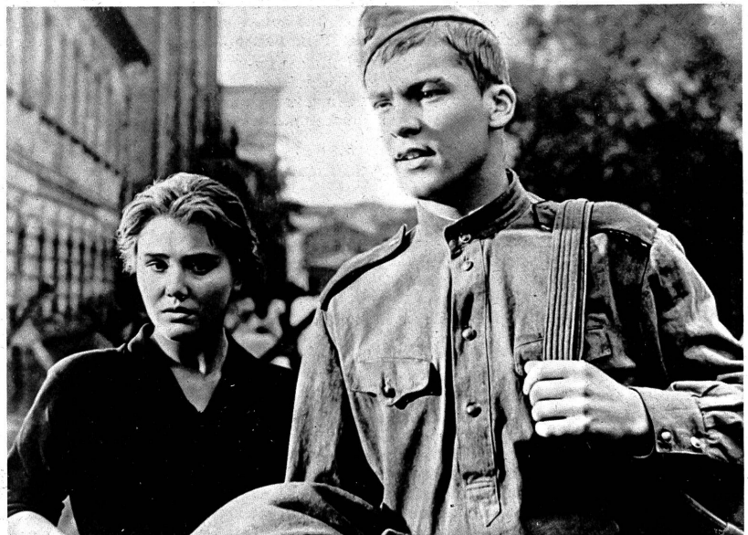
Der russische Soldat als "positiver Held" in dem preisgekrönten, aber umstrittenen und fragwürdigen Propagandafilm "Die Ballade vom Soldaten".

Tschukhray besorgt es seinem Publikum mit dem Gemüt, auch hier, in "Die Ballade vom Soldaten", nach einem Szenario von Valentin Ejoy. Er schreitet unbeirrt und schnurstracks auf der Linie, die Chruschtschew als die für die Köderung eines einerseits aufs "l'art pour l'art" eingeschworenen und eines andererseits aufs Bieder-Erbauliche versessenen westlichen Publikums geeignete Linie herausgefunden hat. Der junge Soldat, ein Held der Sowjetunion, dessen Grab irgendwo im ehemaligen Feindesland (wo?) täglich mit frischen Blumen geschmückt wird als das Grab eines "Befreiers" (und da sagt man, der Film enthalte keine Propaganda), darf eines Tages, als er noch lebt, seiner Tapferkeit wegen Urlaub nehmen. Er macht sich, vom rüstigen, stoppelbärtigen und mit einer blutgetünchten Stirnbinde verzierten General beglickwünscht, auf den Weg, heim zur Mutter (welche Soldaten welcher Nationen gehen nicht heim zur Mutter, wenn sie aus dem Stahlgewitter für eine Weile frei kommen?). Es ist eine Fahrt voller Hindernisse, aber alles renkt sich just im richtigen Augenblick ein: das Fuhrwerk rollt heran, der Lastwagen rattert vorbei, die Fähre ist gerade auf dem Fluss, gute Menschen, vor allem ein Verstümelter, helfen, dass der junge Soldat weiterkommt. Denn selbstverständlich gibt es nur gute Menschen, und wer böse ist, wie zeitweilig ein Offizier, wie zwischenhinein ein Fuhrwerker, kann in seiner zynischen Verärgerung