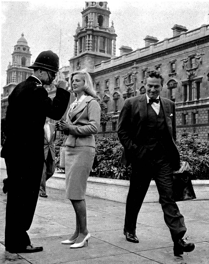
Der Mann der schliesslich als geachteter Parlamentarier ans Ziel kommt, der sich aber selbst verachten muss, (Peter Finch) in "... und morgen alles".

ms. "Hadaka no shima" heisst der japanische Titel dieses Films von Kaneto Shindo, dem Schöpfer des unvergesslichen, in seinem Realismus äusserst grausamen Werkes "Die Kinder von Hiroshima". "Die nackte Insel" ist ein Experiment; den Alltag eines Bauern im Laufe