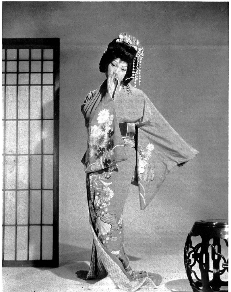
Wer würde in dieser Geisha die begabte amerikanische Schauspielerin Shirley MacLaine erkennen?

ZS. Wir wissen nicht, ob dieser neue Film der Lämppli-Serie ein Kassenerfolg ist, aber wenn es zutrifft, wäre es ein trauriges Zeichen für unser Publikum. Konnte man den Kompagnie-Trottel Lämppli in den früheren Militär-Schwänken noch einigermaßen tolerieren, wenn man beide Augen zudrückte, weil er wenigstens die schlimmsten Auswüchse vermied, und einige gute Stellen aus dem ausgezeichneten "Schwejk" übernahm, so beruht dieser neueste Bild-Erguss auf lauter Geschmacklosigkeiten. Lämppli ist nach Athen gefahren, hat sich dort für die griechische Demokratie begeistert und will sie nun auch in der Schweiz einführen. Aber Parthenon und die Affereien Lämpplis passen nicht zusammen, ganz besonders nicht heute, das hätte ein nicht von allen guten Geistern verlassener Produzent sofort fühlen müssen. Die nachfolgende Handlung ist zudem so massiv-grobschlächtig, erinnert kaum noch an vorstadtmässiges Vereins-Laientheater, mit ihren abgedroschenen Kalauern, den unbeholfenen Versuchen zur Zeitkritik, dass der Film schlechtweg peinlich wird. Ausserdem spielt sich Rasser dauernd in den Vordergrund, denkt nur an sich, dass der Film dilletantisch wirkt. Es hilft da wenig, dass er wiederum die grössten Entgleisungen vermeidet, das Niveau ist zu tief gesunken.