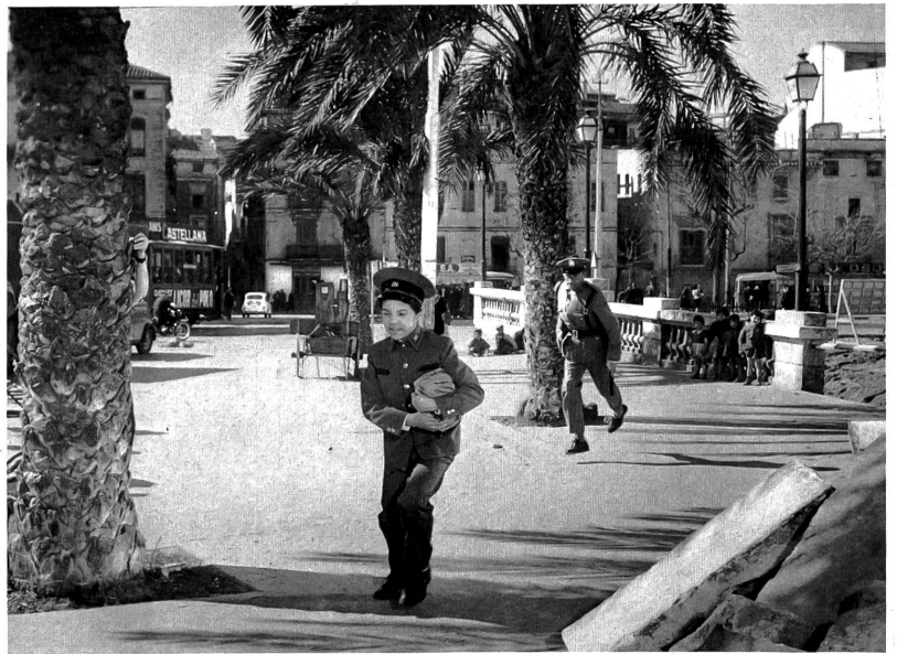
Die Verfolgungsjagd des kleinen Schelmen durch die Stadt schafft hübsche Verwirrungen in "Paco, der Millionendieb"

Charles Crichton hat diese etwas rührselige Geschichte mit seinem spöttischen Geist durchgesetzt. Nach dem kleinen Millionendieb lässt er die ganze Stadt Jagd machen, und diese Verfolgungsjagd, über deren Ausgang von Anfang an kein Zweifel besteht, ist Anlass zu herrlichen Slapstickverwirrungen. Auf diese Weise persifiliert Crichton die Besitzgier der Erwachsenen, die nicht aus Redlichkeit hinter dem Geld her sind, sondern weil sie es selbst gerne haben möchten. Schade ist, dass der Film in Spanien spielt - die Darsteller sind fast alle Importspanier, der Geist des Films ist englisch, und so wäre es richtig gewesen, man hätte den Film in England angesiedelt, mit dessen Menschenschlag Crichton vertraut ist. Die Schnurre ist englisch, und manche Feinheit, die im Drehbuch verborgen liegt, wäre im englischen Milieu richtig und glaubwürdig zur Geltung gekommen. Aber auch so unterhält der Film, er rührt die Herzen der romantischen Zuschauer und lässt allerlei Klugheit ins Gemüt sich gaukeln.