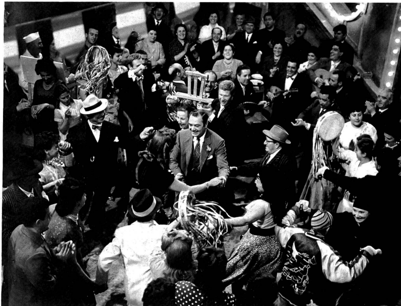
Glanz und Untergang eines selbstherrlichen, dubiosen Volkskönigs in Neapel schildert mit napolitänischer, melodramatischer Weitschweifigkeit der Film "Der König der Bettler"

Dem Film merkt man die Mitarbeit kriminalistischer Fachleute an. Seine Spannung liegt gerade darin, dass er sehr nüchterne und überlegte Ermittlungen zeigt, wenn auch gewisse Pikanterien nicht fehlen. Auch in lokalem Patriotismus wird ein wenig gemacht, indem einem als Gast anwesenden deutschen Kriminalbeamten vordemonstriert wird, wie anders, aber nicht weniger präzise, die Wiener arbeiten. Im Gegensatz zu manchen konstruierten und sensationellen Kriminalreissen haben wir es hier mit einem glaubhaften zu tun, bei dem vor allem die Methode seiner Aufklärung interessieren kann. Das Schwergewicht liegt dabei eindeutig bei der Polizei und weder beim Opfer noch beim Täter. Die Polizei stellt in dem gutgespielten, sympathischen Kriminalrat Radosch den eigentlichen Helden. Wer sich für diese Gattung Film interessiert, bekommt hier einen nicht ganz alltäglichen zu sehen.