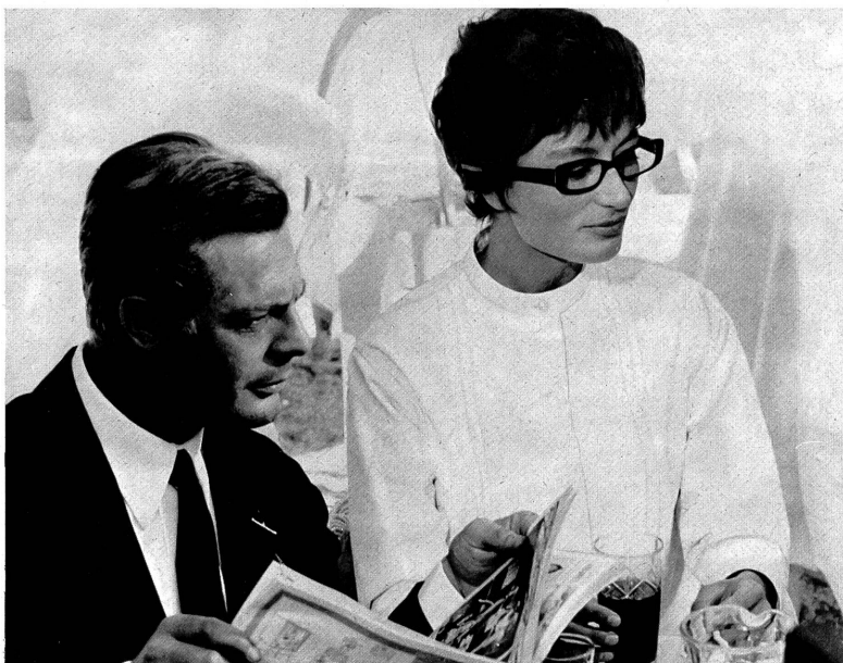
Mastroianni als selbstkritischer Regisseur mit Anouk Aimée in Fellinis "Acht 1/2"

Auf drei Ebenen ist die Handlung angelegt: vor uns erscheint ein Mann, ein Filmregisseur in der Krise seiner Jahre um vierzig, gesundheitlich angeschlagen, seinem Leben gegenüber in einem Gefühl der Schuld verharrend, voller Zweifel über sein Werk, das er bisher geschaffen hat, und besonders vor dem neuen, an dem er sinnt. Dieser Mann erscheint vor uns als der, der er bisher gewesen ist; als der, der er gegenwärtig ist, und als der, der er sein möchte. Er erscheint in den Fakten seines gegenwärtigen Lebens, dessen äussere Umstände gegeben sind durch einen der Pflege der Leber dienenden Kuraufenthalt; von diesen Fakten, dem Umgang mit anderen Kurgästen, dem Verhältnis zu seiner Geliebten, der Bindung zur Ehefrau, der Arbeit an einem neuen Film, gehen die Ströme der Erinnerung zurück in die eigene Kindheit, zu den Eltern, zur Erziehung im katholischen Internat, zur ersten Begegnung mit dem Eros; und es gehen hinweg die Ströme des Wünschens, der Imagination in die Zukunft, in die aus der eigenen Phantasie geschaffene Möglichkeit eines anderen Lebens, in die antizipierenden Vorstellungen, die er von seinem neuen