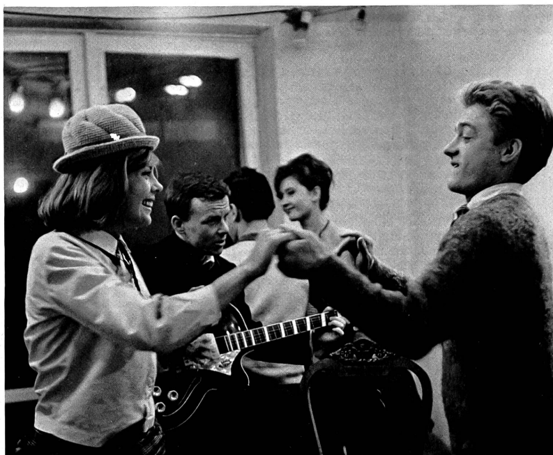
Die Jungen in der ausgezeichneten polnischen Episode des Films "Liebe mit Zwanzig" von Wajda.

Kjaerulff-Schmidt ist der noch sehr jugendlichen Auffassung,